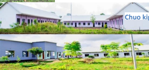
Chuo kipya cha Mafunzo ya Afya MONG`ARE MEDICAL TRAINING COLLEGE