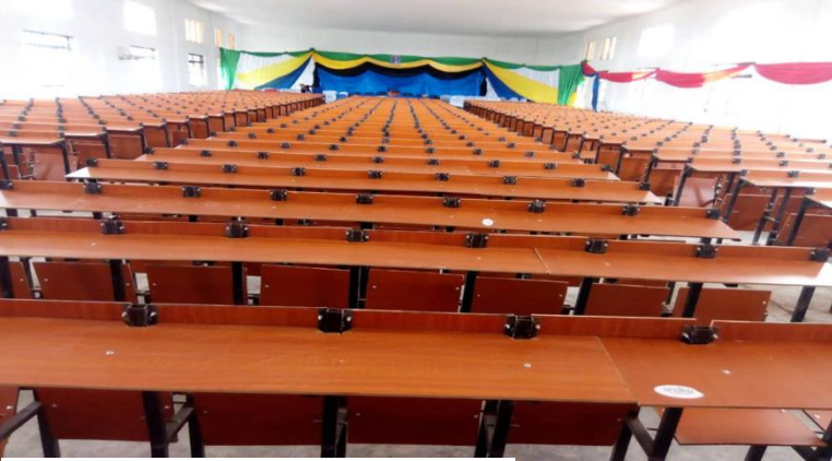
Ukumbi wa WANACHUO MONG`ARE COLLEGE