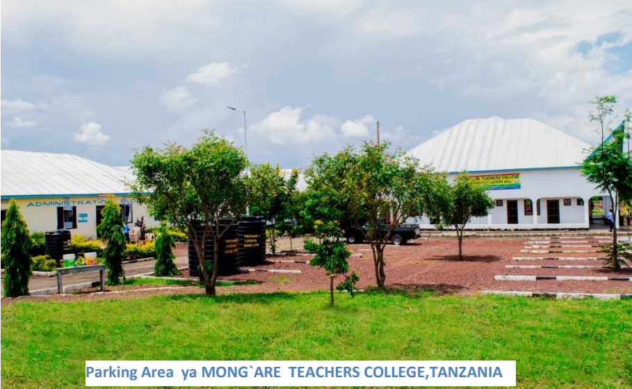
Parking Area ya MONG`ARE TEACHERS COLLEGE,TANZANIA