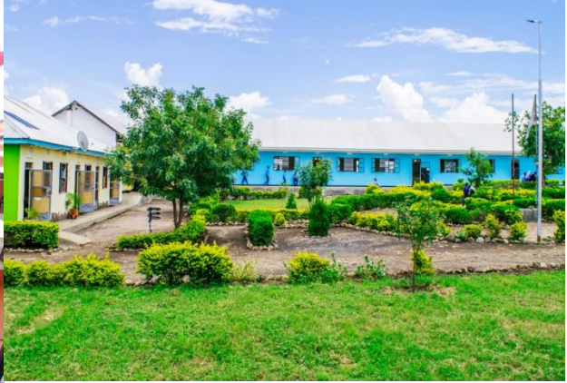
Baadhi ya Madarasa ya MONG`ARE COLLEGE,TANZANIA