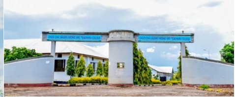
Getini MONG`ARE COLLEGE,TANZANIA