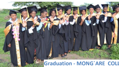
Graduation - MONG`ARE COLLEGE,TANZANIA