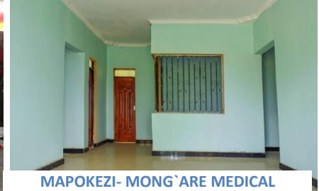
MAPOKEZI- MONG`ARE MEDICAL TRAINING COLLEGE,TANZANIA