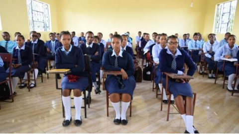
Baadhi ya Wanachuo wa MONG`ARE TEACHERS Computer room- MONG`ARE COLLEGE,TANZANIA wakiwa Darasani